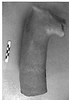
Fig. 2: Aslan Kafalı Libasyon Kap - Lion Head Libation Cup