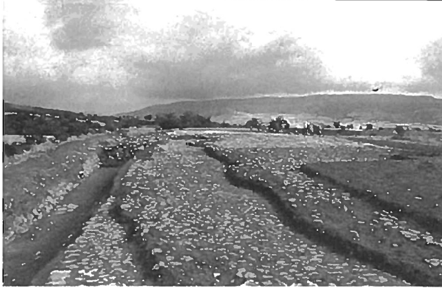
Fig. 6: Taş Döşemli alan 2 - Stone Paved Area 2