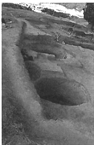
Fig. 4: Silo 1 and 2