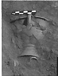
Fig. 9: Tören Kabi - Ritual Cup