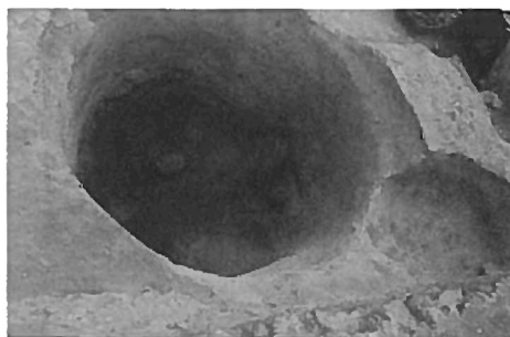
Fig. 5: Silo 1