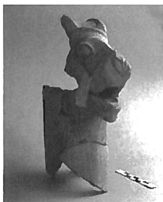
Fig. 1: Aslan Kafalı Libasyon Kap - Lion Head Libation Cup