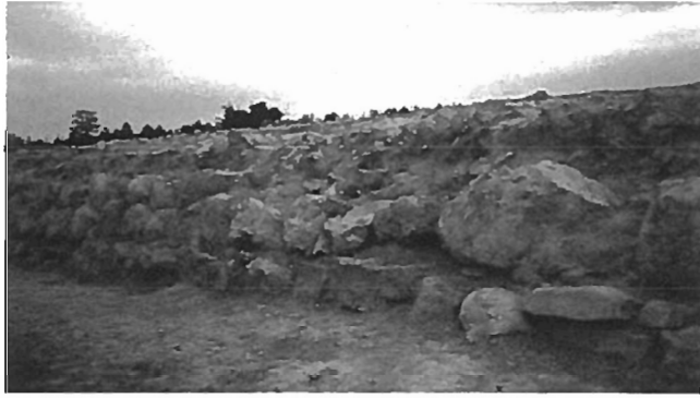
Fig. 7: Taş Döşemli Alan Güney İstinat Duvarı - Stone Paved Area So