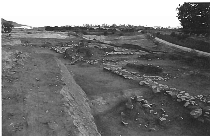
Fig. 3: Bina 1 ve 2 - Building 1 and 2