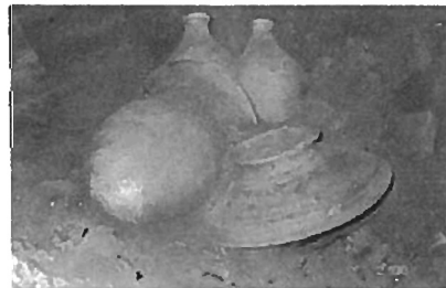
Fig. 10: Tören Kapları - Ritual Cups